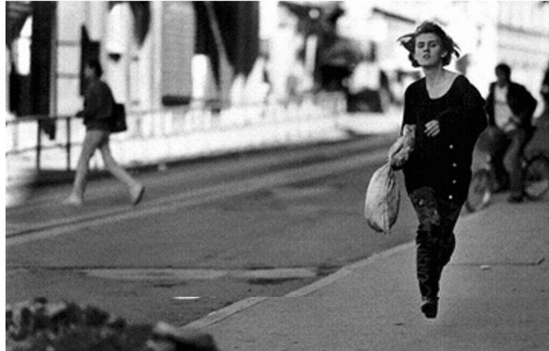
Sarajevo 30 settembre 1993, la ragazza che corre

La ragazza che corre. E' il titolo con cui diventerà famosa una foto che Mario Boccia, fotoreporter e giornalista, scattò il 30 settembre del 1993. A Sarajevo sotto assedio da 17 mesi, un giorno qualsiasi sotto i bombardamenti e il tiro dei cecchini. Il racconto di Mario, vent'anni dopo